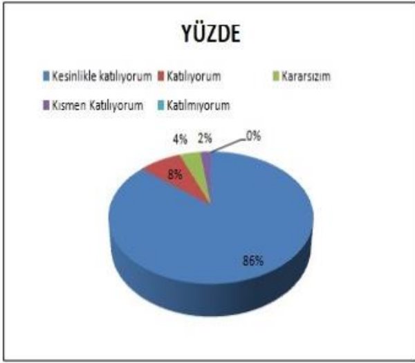
Şekil 3: Öğretmenler Arasında Ayrımcılık Yapılmama Seviyesi "Okulda öğretmenler arasında ayırım yapılmamaktadır." Sorusuna anket çalışmasına katılan 32 öğretmenimizin %93'u Katılıyorum yönünde görüş belirtmişlerdir