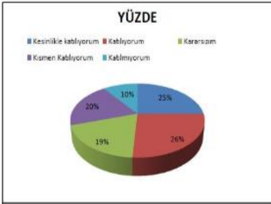
Şekil 3: Öğrencilerin Rehberlik Servisine Ulaşılabilirlik Düzeyi “Okulun rehberlik servisinden yeterince yararlanabiliyorum.” Sorusuna ankete katılan öğrencilerin %61’si Katılıyorum yönünde görüş belirtmişlerdir