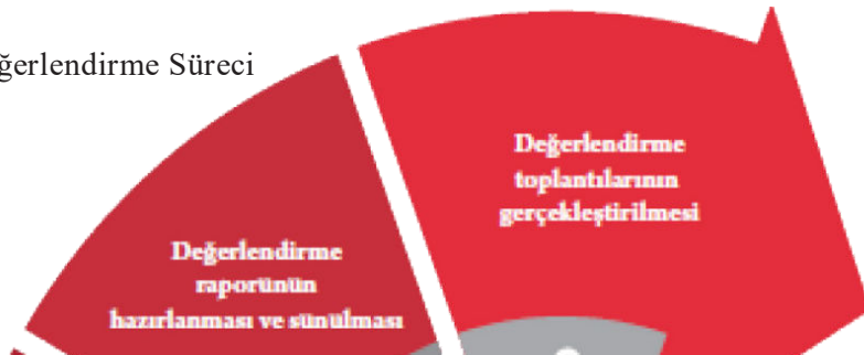
Şekil 2 : İzleme ve Değerlendirme Süreci

Stratejik Plan Değerlendirme Raporu, üst yönetici başkanlığında yapılan değerlendirme toplantısında stratejik planın kalansüresi için hedeflere nasıl ulaşılabileceğinin ilişkin alınacak gerekli önlemleri de içerecek şekilde nihai hâle getirilecektir. Hedeflerin ve ilgili performans göstergeleri ile risklerin takibi, hedeften sorumlu birimin harcama yetkilisinin; hedeflerin gerçekleşme sonuçlarının harcama birimlerinden alınarak raporlaştırılması, analizi, değerlendirilmesi ve üst yöneticiye sunulması sağlanacaktır.