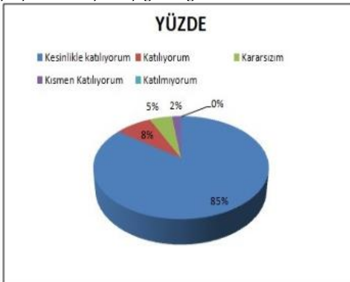
Şekil 1: Velilerin Ulaşabilme Seviyesi "İhtiyaç duyduğumda okul çalışanlarıyla rahatlıkla görüşebiliyorum" sorusuna ankete katılmış velilerin %93'i olumlu yönde görüş belirtmişlerdir.

Veli Anketi Sonuçları: Okulumuzda öğrenim gören öğrencilerin velilerine yönelik gerçekleştirilmiş olan anket çalışması sonuçları aşağıdaki gibidir.