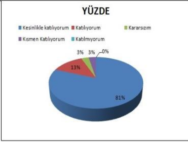
Şekil 4: Velilerin Ulaşabilme Seviyesi “Çocuğumun okulunu sevdiğini ve öğretmenleriyle iyi anlaştığını düşünüyorum” sorusuna ankete katılmış velilerin %94’ü olumlu yönde görüş belirtmişlerdir.