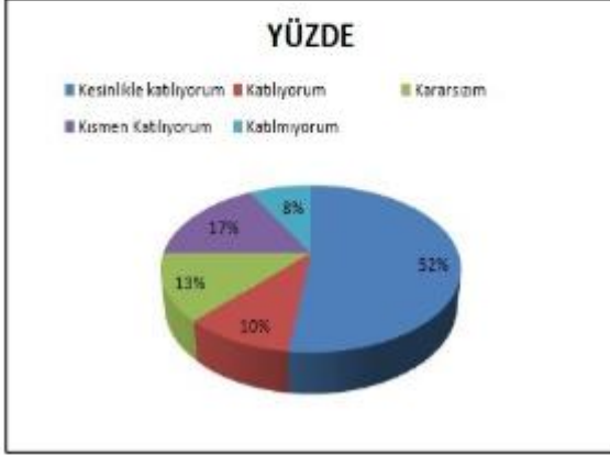
Şekil 4: Öğrencilerin Güven Düzeyi “Okulda kendimi güvende hissediyorum.” sorusuna ankete katılan öğrencilerin %62’si Katılıyorum yönünde görüş belirtmişlerdir.

Öğretmen Anketi Sonuçları: Okulumuzda görev yapmakta olan toplam 32 öğretmenin tamamına uygulanan anket sonuçları aşağıda yer almaktadır.