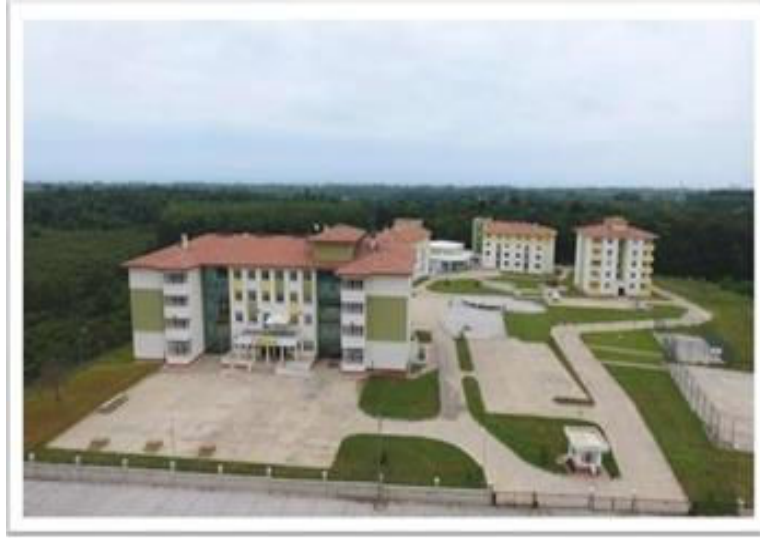
Şekil 1: Okul ve Pansiyon Binaları

Okulumuz, Bölgemizde bulunan OMV firmasının bağışları ve dönemin Belediye Başkanı Sayın Şenol KUL'un katkıları ile 2013 yılında temeli atılmıştır. 2015-2016 Eğitim Öğretim yılında hizmet vermeye başlayan okulumuz aynı yıl fen lisesi olarak ilk öğrencilerini sınavla almıştır. 2017-2018 Eğitim öğretim yılında Fen Liselerinin Proje Okulu olması süreci ile birlikte Proje Okuluna dönüşmüştür. Şu an proje okulu olan kurumumuz ilk mezunlarını 2018-2019 Eğitim Öğretim yılında vermiştir.2022-2023 eğitim öğretim yılında okulumuzun adı Terme Fen Lisesi olarak değişmiştir.